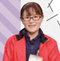
ふれあいらんど萩 久光副店長